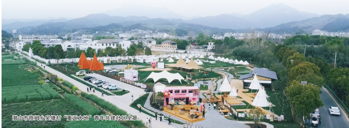
潜山市痘姆乡吴塘村“重返大地”青年共建社区全景。