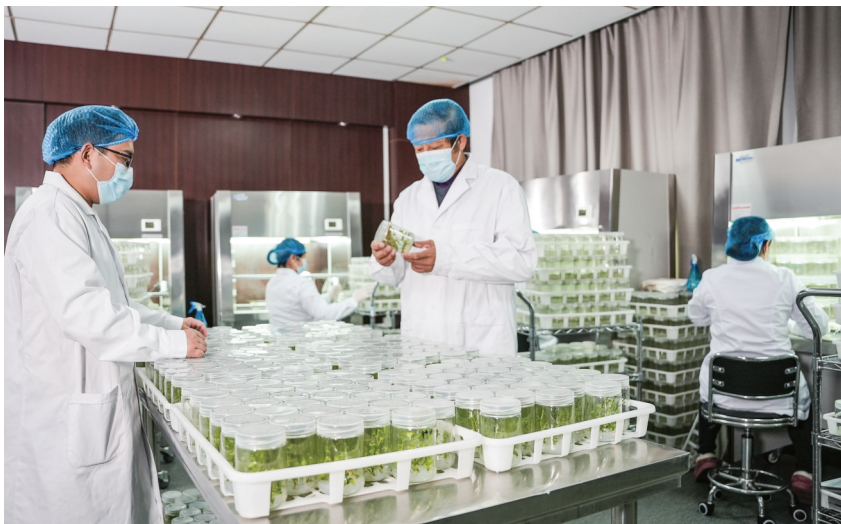
安徽有余跨越食品开发股份有限公司组培室内，工作人员正在查看瓜蒌种苗生长情况。

过去，潜山瓜蒌长期停留在野生驯化、粗放种植阶段，产量低、口感不佳，农户种植积极性不高。为推动瓜蒌产业破局，潜山市组织当地龙头企业与安徽农业大学、安徽省农科院等科研院校协同攻关，持续深耕品种改良与关键技术研发，成功培育出